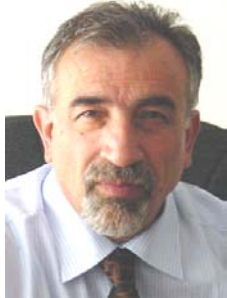
ئەبووبه کر موده پرسی