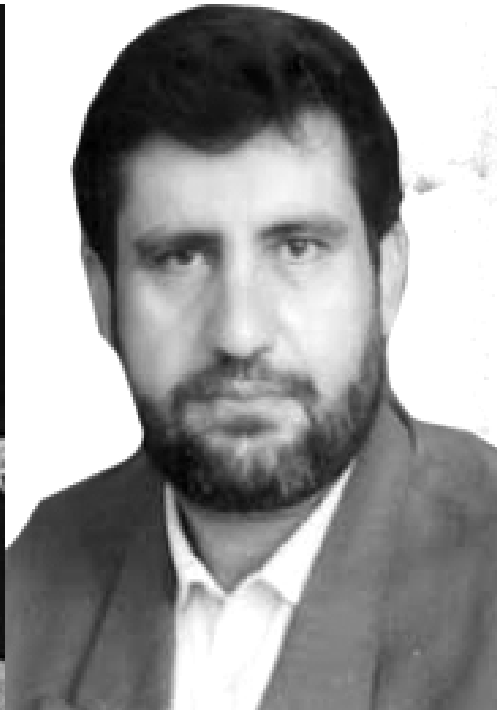
ئىسماعىلى نەجارى ئوستاندارى ئىستانى کوردستان

سەرەنجام نوای چەند مانگ باس و لیکۆلینەو لە نێوان نوینەرانى ئوستانى کوردستان وەزیری ناوڤۆ، ئىسماعیل نەجارى لە لایەن مستەفا پورمخەمەدى وەزیری ناوڤۆوە وەك ئوستاندارى رژىم بۆ ئەم پۆستە دیارى کرا. دەستىنشان کردنى ئىسماعىلى نەجارى بۆ پۆستى ئوستاندارى لە بەرگى ئێران بۆ پۆستى ئوستاندارى لە دىژەى هەمان سیاسەتى ملیتارىستى و پیکهینانى کەش و هەواى نىزامى بە سەر ئورگان و دامەزرێوانى و لە ئاکام دا پیکهینانى ترس لە کۆمەڵگادا بەرپۆه دەچیت، کە بە هاتنى ئەحمەدى نژاد لە ئاستىکى بەرین و دوژمنکارانەتر بەرامبەر بە خەلكى کوردستان دەچیتە پێش.